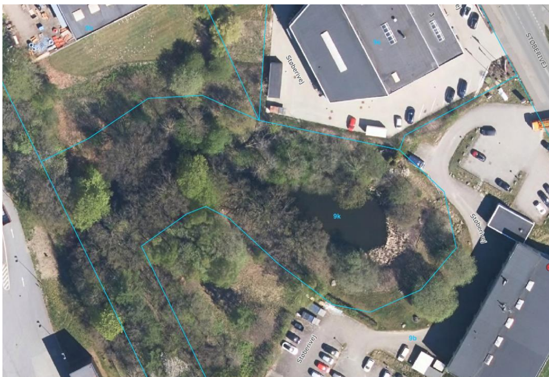
Figur 3: Luftfoto fra 2023

Skriv sikkert til Helsingør Kommune via digital post