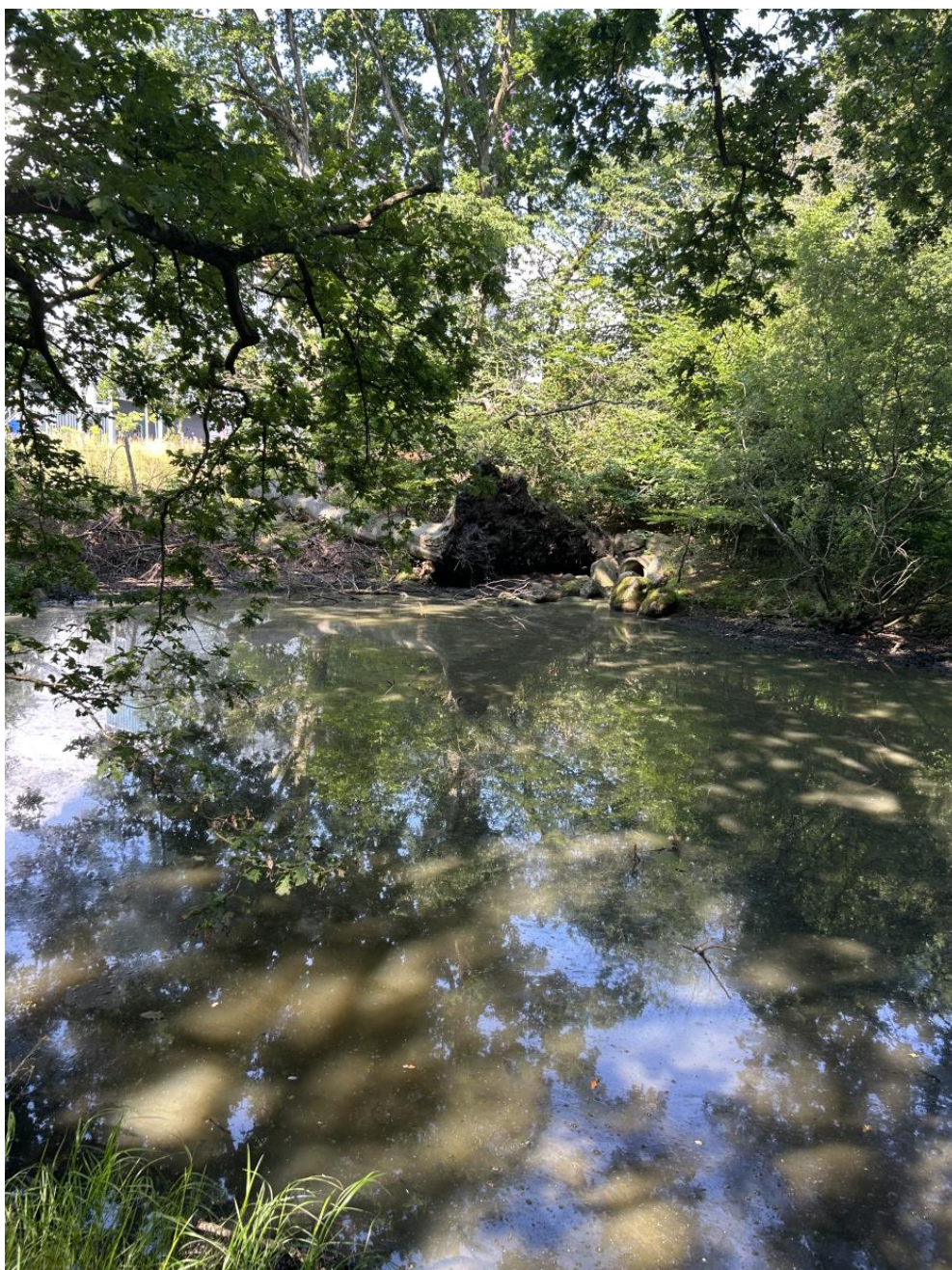
Figur 5: Den vestlige del af søen.

Vi vurderer at vandstanden er meget lav på grund af ophobning af bundsediment/slam i søen.