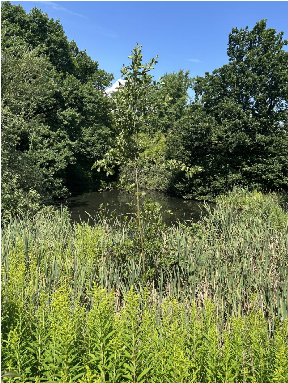
Figur 4: Den østlige side af søen.

Den vestlige del af søen er meget skygget. Der er ingen rørskov i denne del af søen.