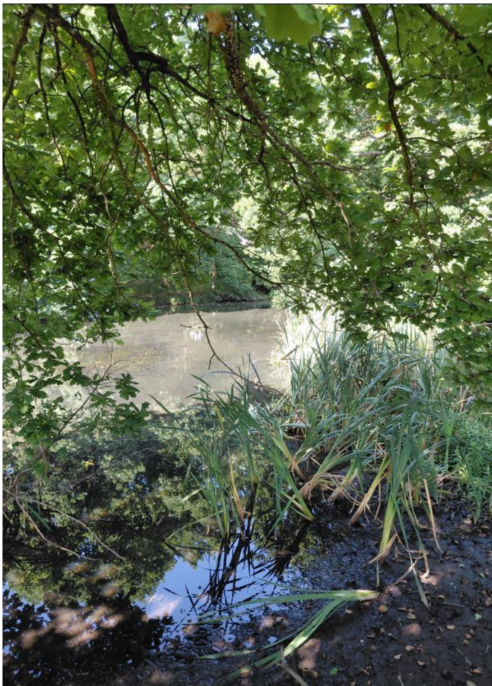
Figur 3: Den nordøstlige del af søen.

Vi kunne se at der er en stor forekomst af dunhammer i den østlige side af søen på den lavtliggende del. Gyldenris er meget dominerende på den højtliggende del af matriklen. ↓