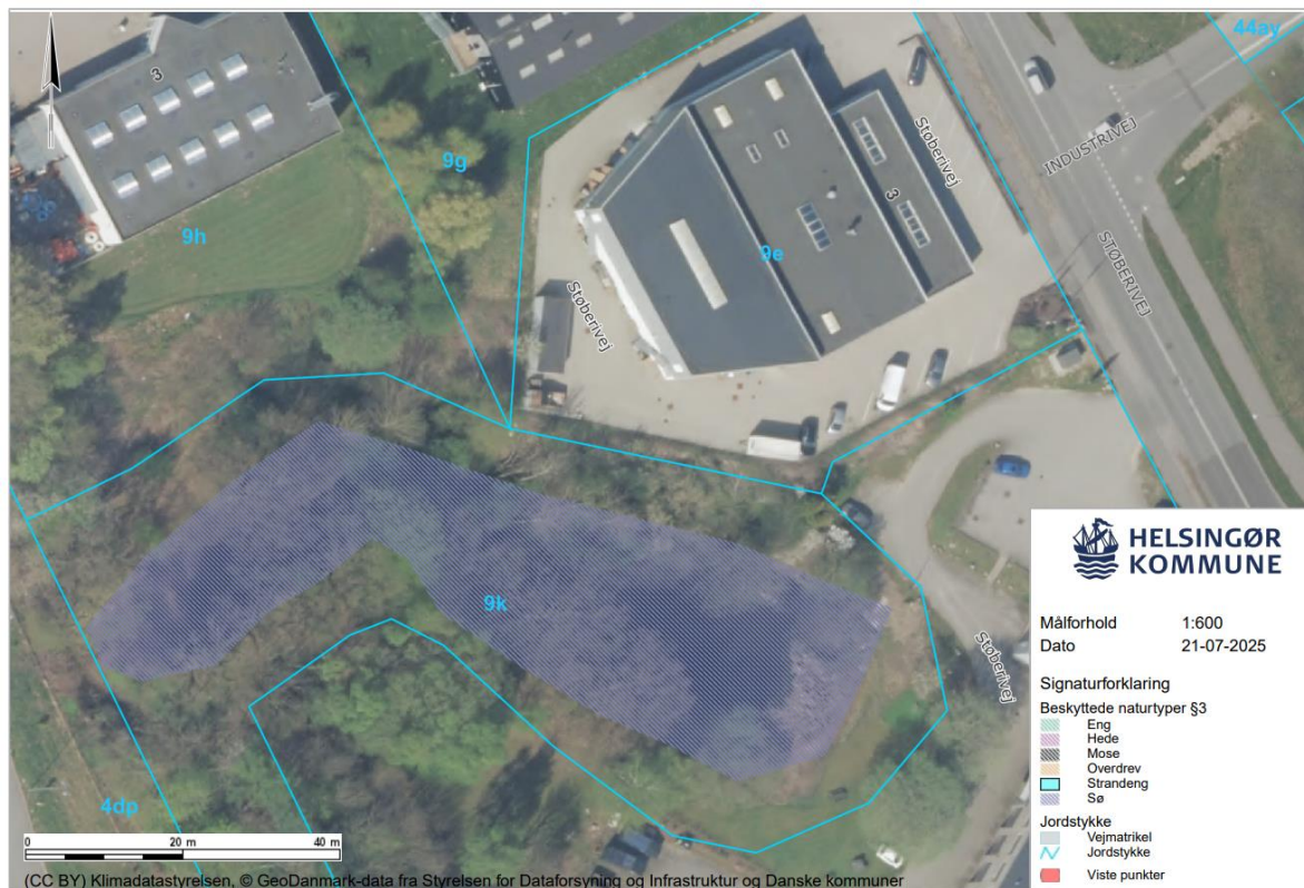
Figur 2: Den nuværende afgrænsning af den beskyttede sø vist med blå skravering.

Du oplyste, at oprensningen af regnvandsbassinet vil foregå i 2025 og at oprensningen vil vare ca. 3 uger. Oprensningen vil foregå ved at jeres entreprenør vil grave bundsedimentet af bassinet ned til den faste bund. Du oplyste, at I vil foretage oprensningen fra bassinets side mens dette i drift og pumper vandet til kloaksystemet.