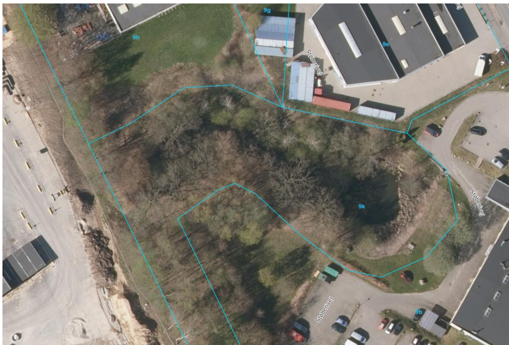
Figur 2: Luftfoto fra 2017